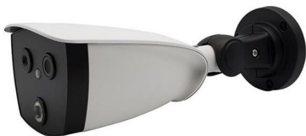
■カメラ設置フルパッケージ 設置イメージ